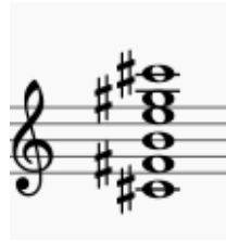
Compás 1 (Flauta)